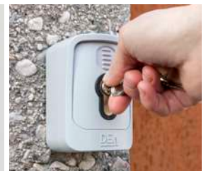
Selector de llave GT-KEY