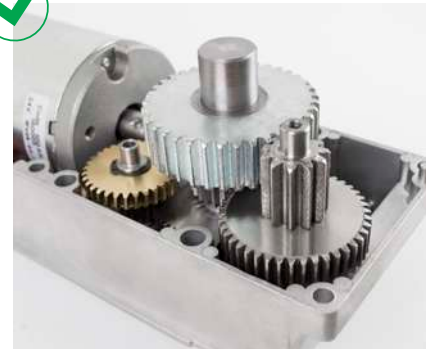
Mecánica interna sólida con componentes en metal y cojinetes de bolas para una mayor durabilidad