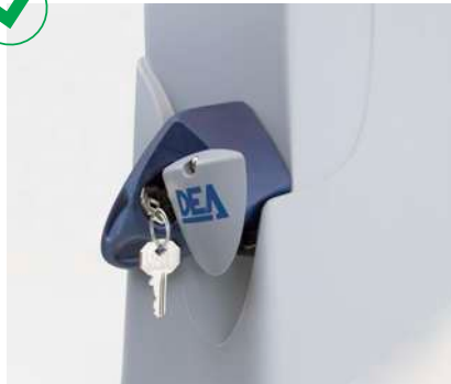
Dispositivo de desbloqueo manual con llave personalizada