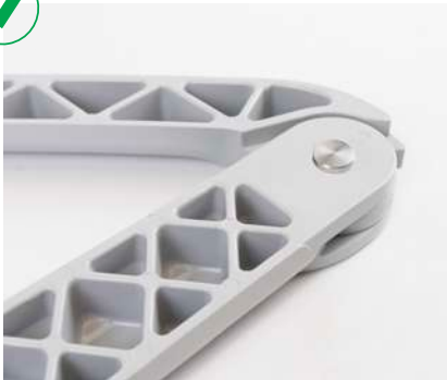
Brazo de aluminio reforzado