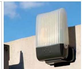
Lámpara de led AURA